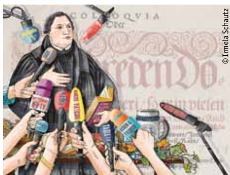
Der rebellische Mönch, die entlaufene Nonne und der größte Bestseller aller Zeiten – Martin Luther (Gabriel 2017)