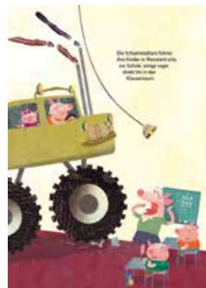
Illustration aus: Klimaschweine, Kunstanstifter Verlag 2020